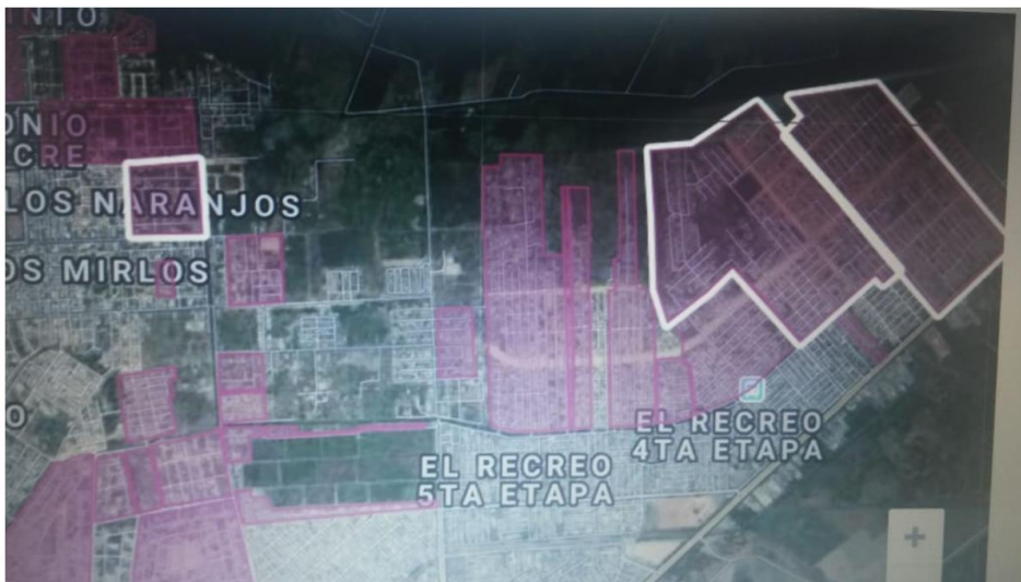
Figura 1. Ubicación de los asentamientos visitados en Durán

Los resultados efectuados muestran que la mayoría de las personas que accedieron a la capacitación estaban entre el rango de edades desde los 19 años hasta los 40 años.