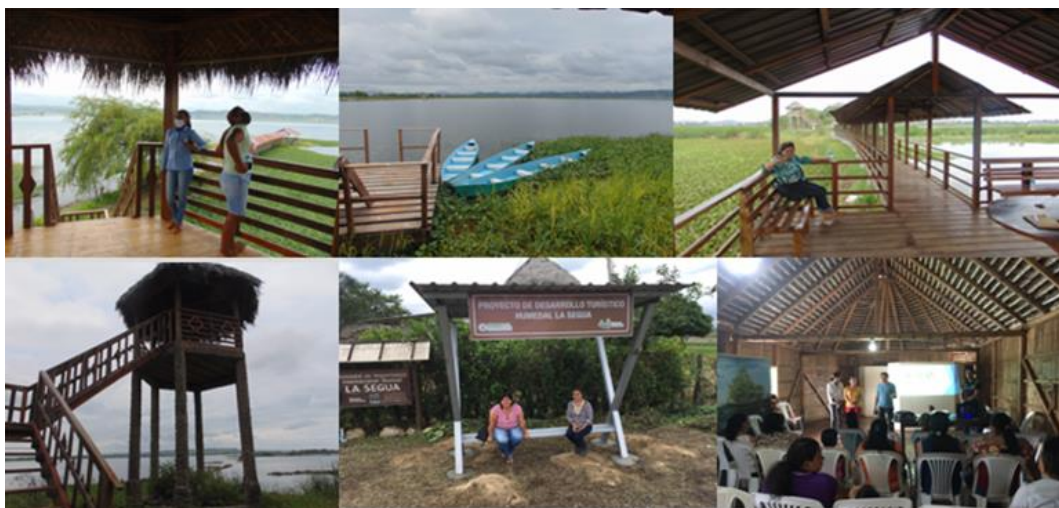
Imagen 2. Facilidades turísticas humedal La Segua

A continuación, se presenta un mosaico de imágenes evidenciando el uso del suelo y sus facilidades turísticas.