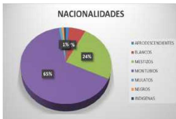
Figura 5. Nacionalidades de los admitidos en los años 2020-2021. Fuente. Entrevista realizada a la Jefa de admisión y nivelación de la ESPAM MFL.