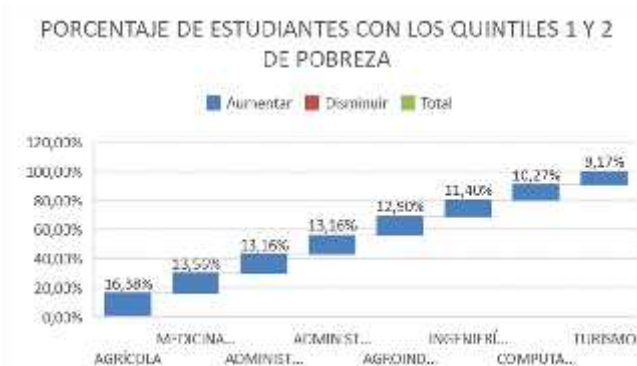
Figura 9. Porcentaje de estudiantes con los quintiles 1 y 2 de pobreza.

De acuerdo a la información presentada por la entrevista, se sostiene que el 4.25% de los alumnos admitidos financian sus estudios con ahorros personales, mientras que el 4.89% a través del apoyo de sus cónyuges; el 35.39%, del sustento de sus madres. Por otra parte, el 30.63% reciben ayuda de sus padres y el 2.83% de otros familiares. También existen estudiantes que continúan sus estudios por beneficiarse del bono de desarrollo humano: estos reflejan el 0.51%. El 11.33% mediante sus trabajos, el 1.16% de otras fuentes, mientras el 9.01% no poseen ningún tipo de ayuda en su formación universitaria.