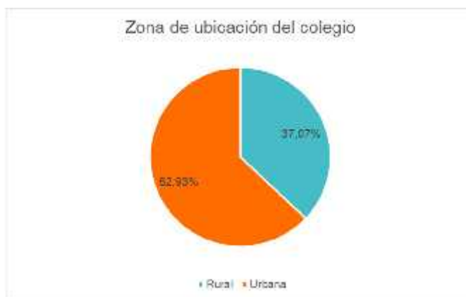
Figura 7. Zona de ubicación del Colegio del que provienen los alumnos admitido en los años 2020-2021. Fuente. Entrevista realizada a la Jefa de admisión y nivelación de la ESPAM MFL.

En la figura 6, se describe que el 80.31% de los estudiantes admitidos provienen de colegios fiscales; asimismo, el 3.86% son graduados de instituciones fiscomisionales, el 14.41% son bachilleres de colegios particulares, finalmente el 1.42% de otro tipo de unidades educativas.