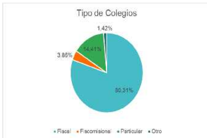
Figura 6. Tipo de Colegio del que provienen los alumnos admitidos en los años 2020-2021. Fuente. Entrevista realizada a la Jefa de admisión y nivelación de la ESPAM MFL.

En la figura 6, se describe que el 80.31% de los estudiantes admitidos provienen de colegios fiscales; asimismo, el 3.86% son graduados de instituciones fiscomisionales, el 14.41% son bachilleres de colegios particulares, finalmente el 1.42% de otro tipo de unidades educativas.