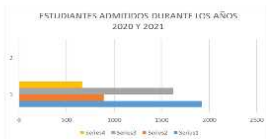
Figura 1. Estudiantes admitidos durante los años 2020 y 2021.

Se indagó el número de alumnos admitidos en la Institución de Educación Superior (IES), donde la jefe de admisión y nivelación proporcionó los siguientes datos: