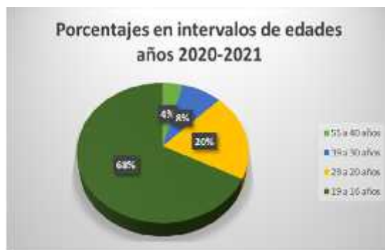
Figura 4. Intervalos de edades de los admitidos en los años 2020 y 2021.

Durante los años 2020 y 2021 el género femenino ocupó el porcentaje más alto de los admitidos, con un 52%, mientras que el 48% pertenece al género masculino, según los datos de la Matriz de Tercer Nivel generada por la Senescyt.