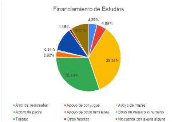
Figura 8. Financiamiento de estudios de los alumnos admitido en los años 2020-2021.

Fuente. Entrevista realizada a la Jefe de admisión y nivelación de la ESPAM MFL.