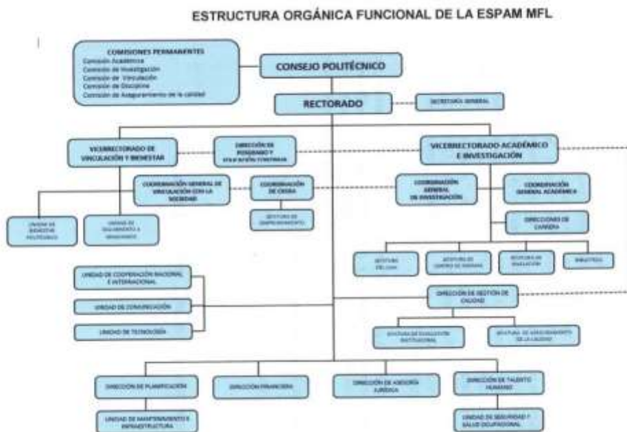
Figura 2. Orgánico funcional de la ESPAM MFL.

Esta estructura responde a los procesos y procedimientos que apoyan el funcionamiento institucional, articulando la operatividad de cada una de las áreas y dependencias para responder eficientemente a las demandas institucionales y de los órganos que rigen la educación superior en el país.