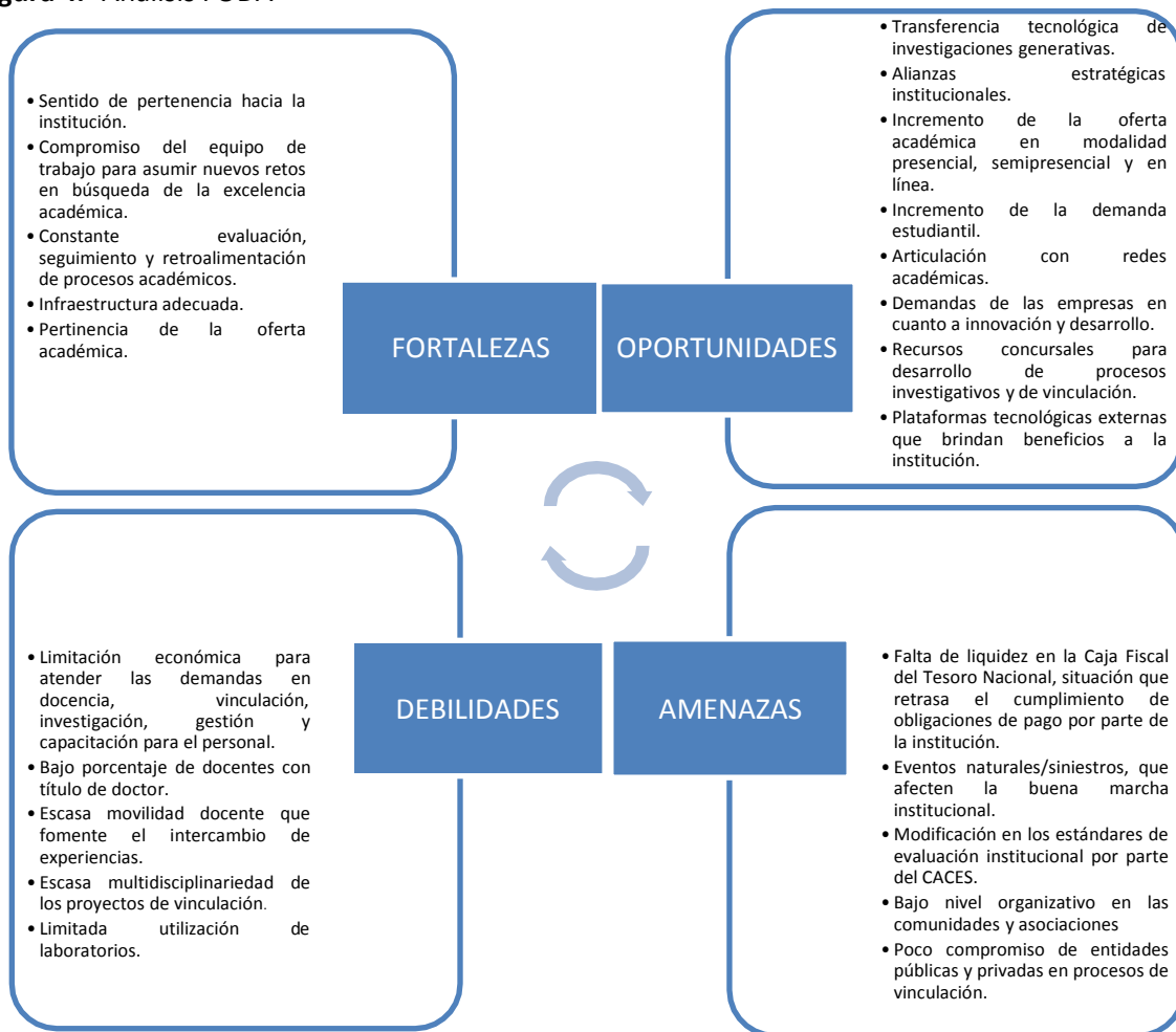
Figura 4.- Análisis FODA