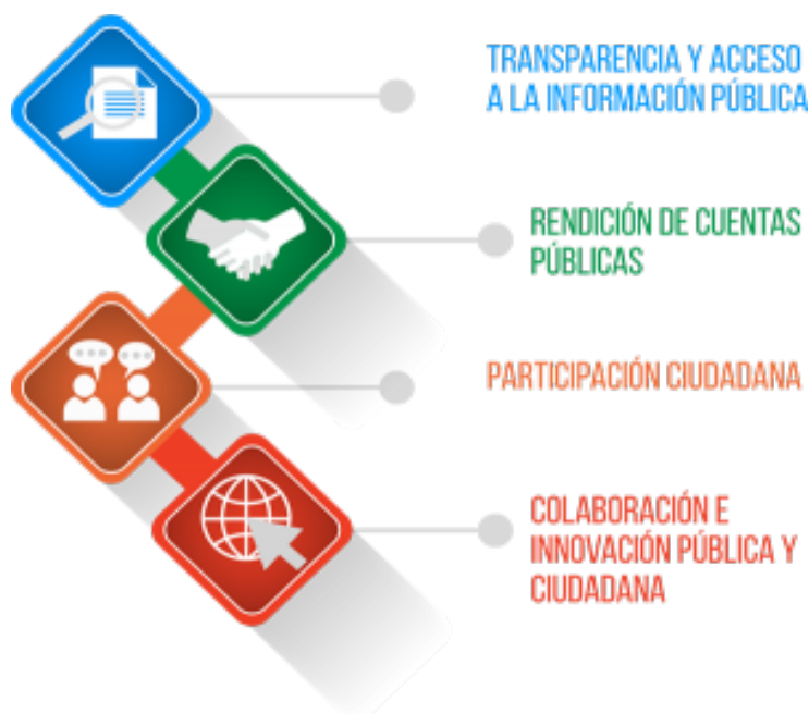
Figura 1. Pilares del Gobierno Abierto

cuenta con el apoyo de organismos internacionales, que se cuentan con tipologías y que dentro del Gobierno Abierto es esencial para ensanchar la transparencia y la rendición de cuentas de los gobiernos. Gobierno Abierto se fundamenta en cuatro pilares: