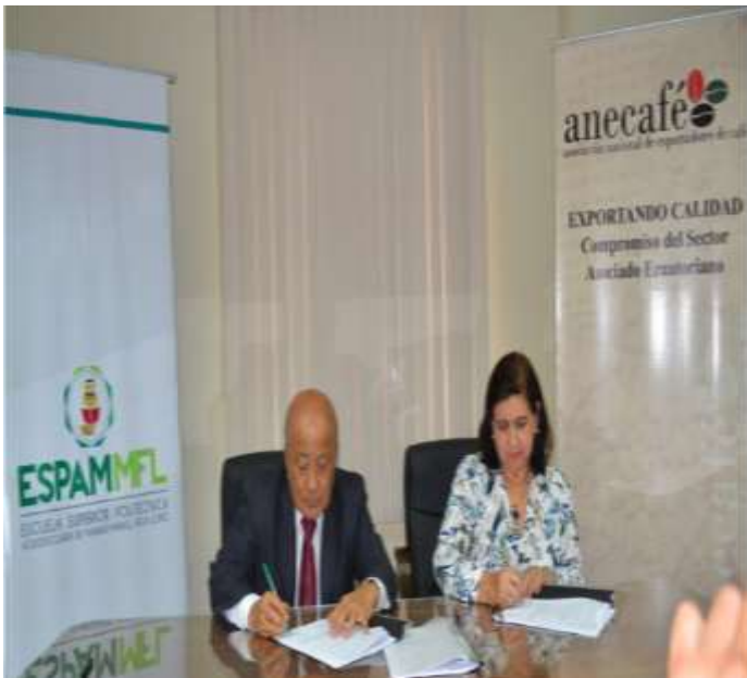
ASOCIACION NACIONAL DE EXPORTADORES DE CAFÉ