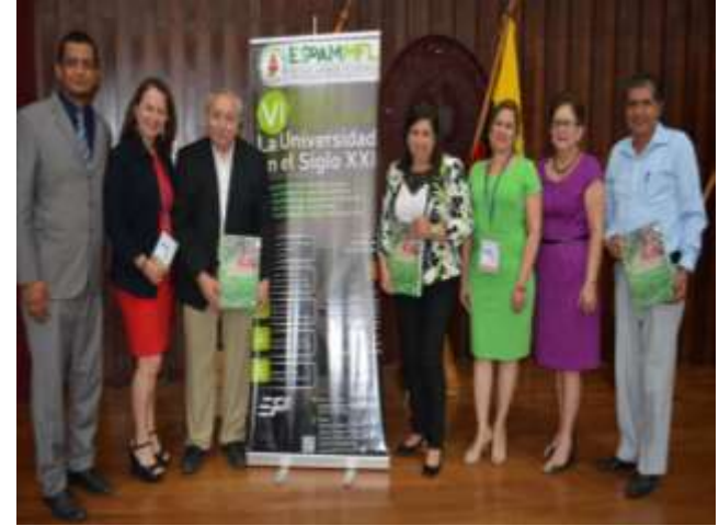
I CONGRESO INTERNACIONAL DE AGROINDUSTRIA, CIENCIA Y TECNOLOGÍA DE ALIMENTOS.