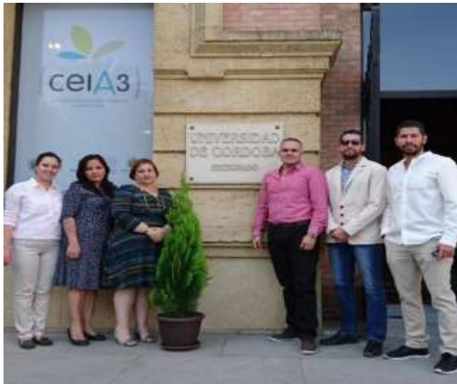
UNIVERSIDAD DE CORDOBA- ESPAÑA