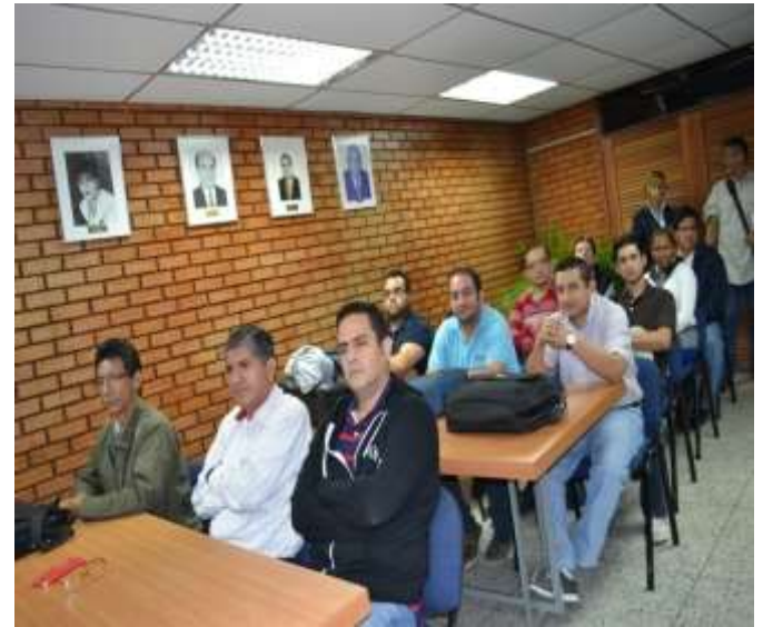
UNIVERSIDAD DEL ZULIA-VENEZUELA