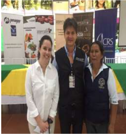
II Concurso Taza Dorada en Lago Agrio Auditorio de la Alcaldía del Cantón Lago Agrio