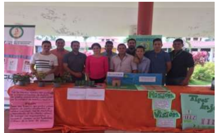
I FERIA DE EMPRENDIMIENTO DE LA CARRERA DE INGENIERÍA AGRÍCOLA