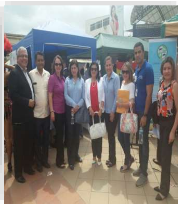
PARTICIPACIÓN EN LA FERIA DE OFERTA ACADÉMICA DE LA ESPAM MFL