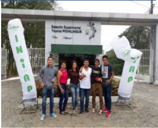
LABORATORIOS INIAP QUEVEDO