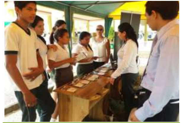
FERIA AGROINDUSTRIA ESPAM MFL