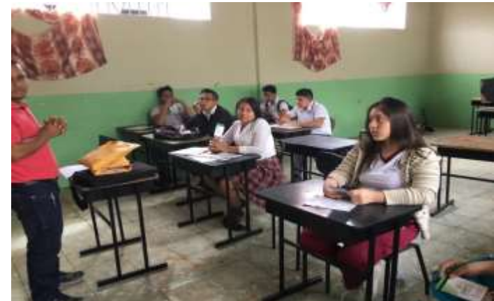
COLEGIO MERCEDES EN PORTOVIEJO