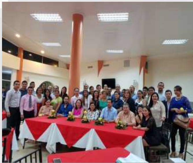
EVENTO DIRIGIDO A ESTUDIANTES Y DOCENTES DE LA CARRERA