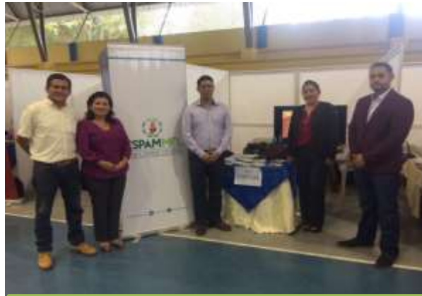
COLEGIO CRISTO REY