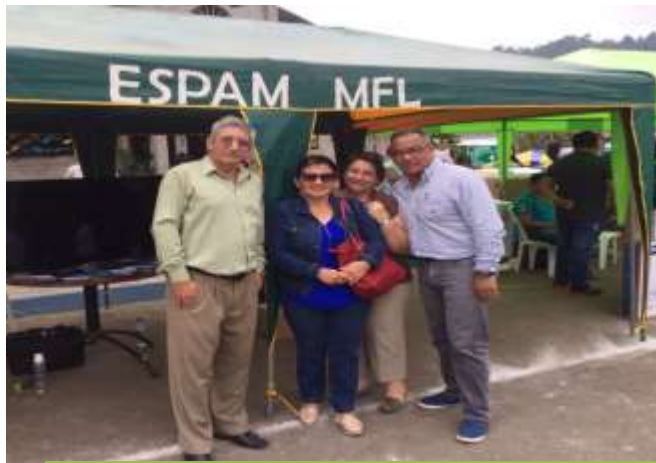
FERIA EN LA PARROQUIA MEMBRILLO