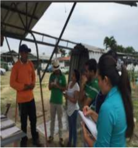
BANANERA NUEVA ESPERANZA