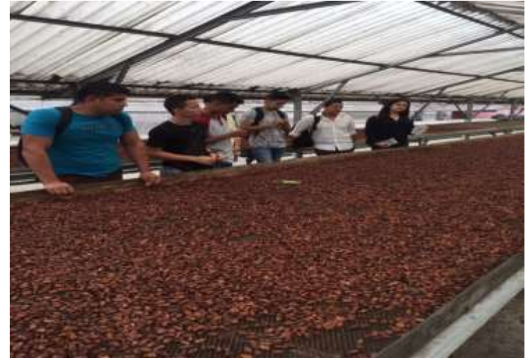
VISITA TECNICA DE OBSERVACION EN LA CORPORACION FORTALEZA DE VALLE - CALCETA