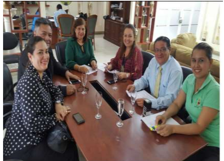
UNIVERSIDAD ZULIA - VENEZUELA