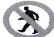
Prohibido pasar a los peatones