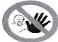
Entrada prohibida a personas no autorizadas