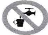
Agua no potable