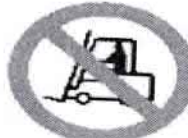
Prohibido a los vehículos de mantenimiento