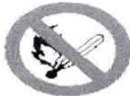
Prohibido fumar y encender fuego