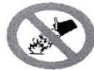
Prohibido apagar con agua