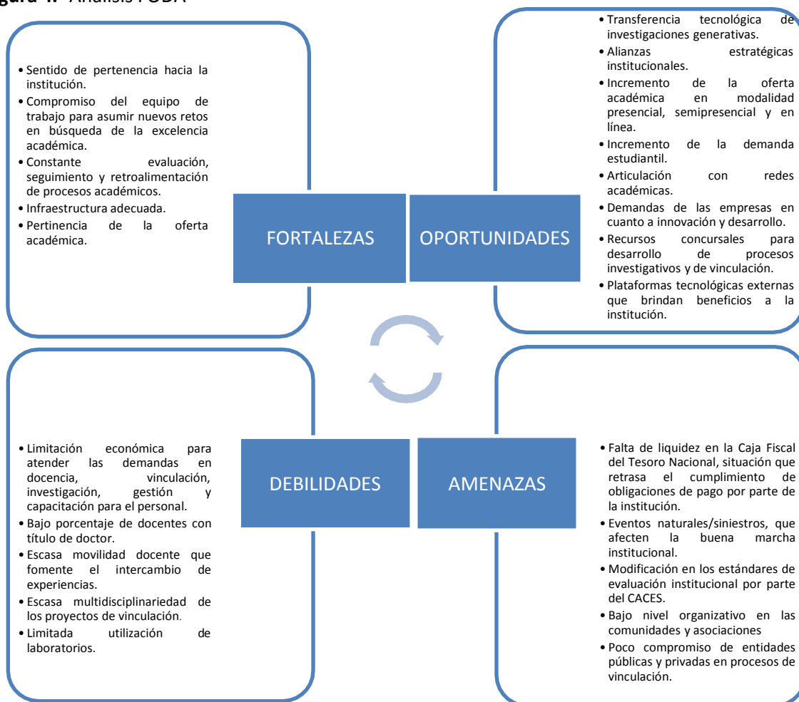
Figura 4.- Análisis FODA