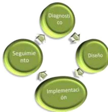
Figura 3: Etapas del PEDI

Siendo la matriz FODA un modelo de análisis básico para diseñar la estrategia institucional sirvió para plantear las acciones que se deberán poner en marcha para aprovechar las oportunidades detectadas y eliminar o prepararse ante las amenazas, teniendo conciencia de las propias debilidades y fortalezas de la institución.